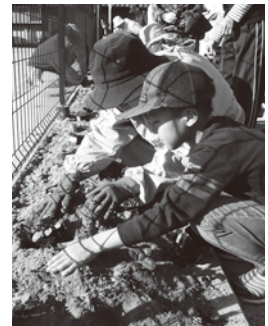
花 植 え

このような地域の方々との交流を通して、子どもたちにも地域の方々を支えられていることを伝えていきたいと思います。今後ともご協力をお願いいたします。